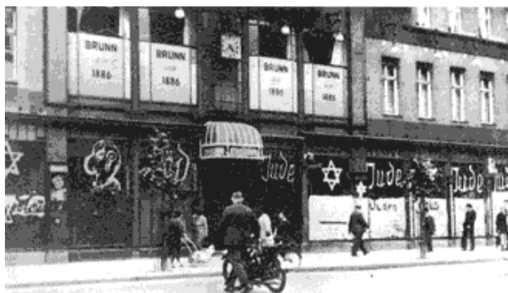
Doc.3 : un magasin juif après 1933 à Berlin.