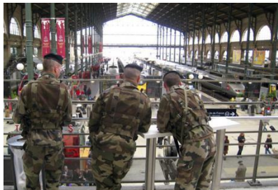
Soldats à la gare du Nord à Paris pour le plan Vigipirate