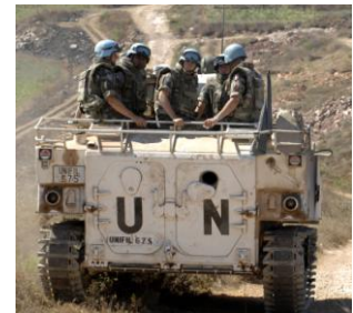
Casques bleus français de la FINUL déployés au Sud-Liban en 2007