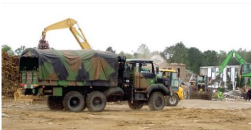
Intervention de l'armée après la tornade d'Hautmont en août 2008