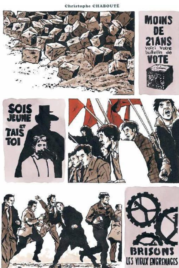
Planche de Christophe Chabouté in Mai 68, le pavé de bande dessinée , édition Soleil, 2008.