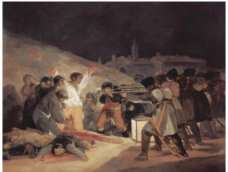
Tres de Mayo ou les fusillades sur la montagne du Prince Pio par Francisco Goya, 1814, 2,66m x 3,45m, musée du Prado, Madrid