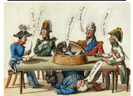
caricature RNF Paris