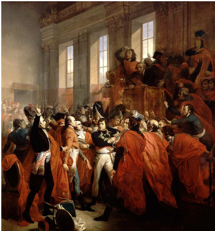
Document 1 : François Bouchot, Le général Bonaparte au Conseil des Cinq-Cents, à Saint Cloud. 10 novembre 1799 , 1840, huile sur toile de 421x401cm, Musée national du Château de Versailles