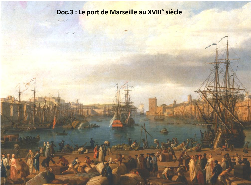
Joseph Vernet, Intérieur du port de Marseille , huile sur toile, 165x263 cm, 1754, Musée national de la marine, Paris

Répondez aux questions suivantes en étudiant les documents :